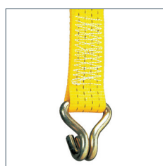
SPH - mit Spitzhaken