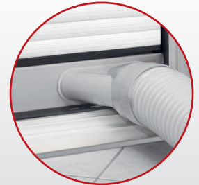
Inkl. Fenster-Kit und Abluftschlauch