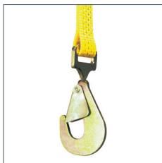
GKH - mit gedrehten Karabinerhaken