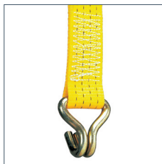
SPH - mit Spitzhaken