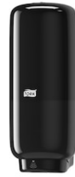
Tork Soap-Sanit Disp – Int Sens, bl 561608