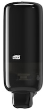
Tork Spender Schaumseife Elev schwarz S4 561508