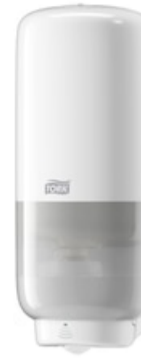
Tork Soap-Sanit Disp – Int Sens, wh 561600