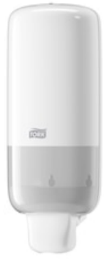
Tork Spender Schaumseife Elev weiß S4 561500