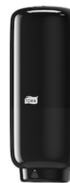
Tork Soap-Sanit Disp – Int Sens, bl 561608