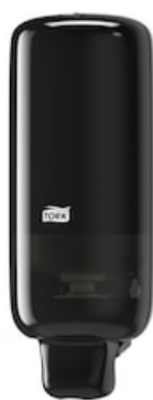
Tork Spender Schaumseife Elev schwarz S4 561508