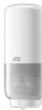
Tork Soap-Sanit Disp – Int Sens, wh 561600