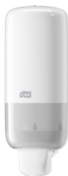
Tork Spender Schaumseife Elev weiß S4 561500